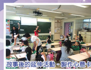
故事後的延伸活動-製作心意卡