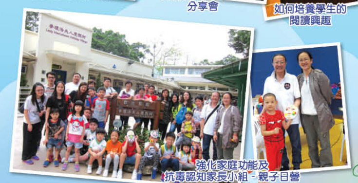
強化家庭功能及抗毒認知家長小組-親子日營