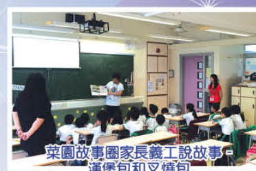
菜園故事圈家長義工說故事、漢堡包和叉燒包

這個計劃為本校增添了閱讀氣氛之外，亦刺激了家長思考閱讀對孩子成長的重要，相信家長會更積極與子女進行親子閱讀。菜姨姨和她的義工團以及我們的家長義工為推動閱讀、培育孩子盡心盡力，在此衷心感謝她們！