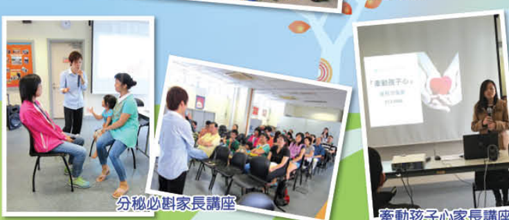
分級必樹家長講座