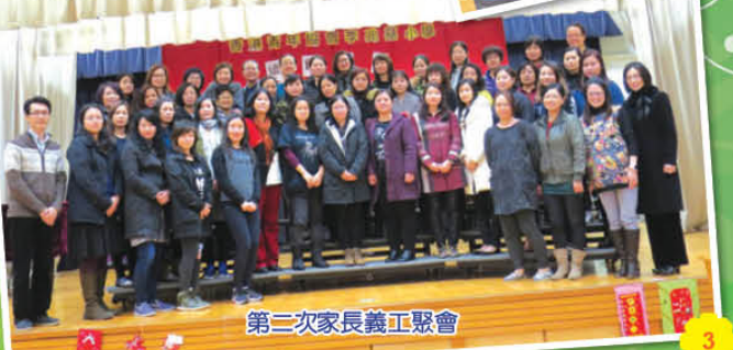
第二次家長義工聚會