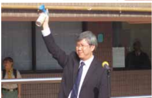
羅校長一聲響號，比賽隨即展開