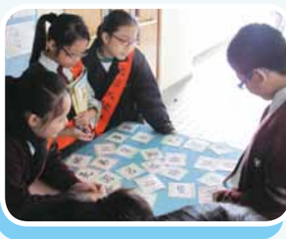
普通話攤位遊戲都擠滿了人！多玩多得蓋印呢！