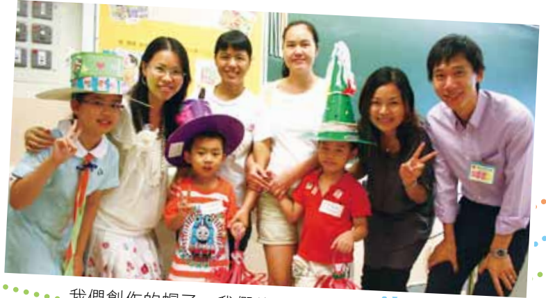
我們創作的帽子，我們的笑容，哪個更吸引？