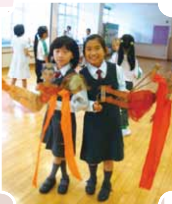
皮影班同學在排練