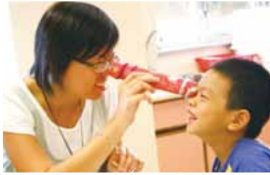
老師與幼生相處多融洽！

為了讓本區幼稚園高班學生及家長及早體驗小學生活，以便升讀小一時能盡快適應小學課程，先後舉辦「小學生活新體驗」、「科藝創意親子體驗日」活動。內容包括電腦機械人製作、親子視藝創作及親子英語唱遊。來自本區不同幼稚園的學生，經本校老師引導下，均能充分發展其語文及科藝創意潛能；同時，亦讓家長初步認識本校的課程特色。