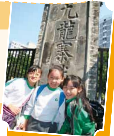
遊九龍寨城學寫遊記

我們懷依依不捨的心離開這個歷史文化之地。在回程的路上，大家還興致勃勃地談在九龍寨城公園裏看到的新奇事物，同學們吵得連車頂都快被掀起了！在這天，我真的感到無比的快樂！