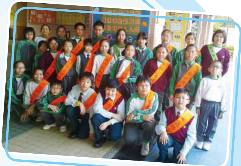
這些是我們今年的普通話大使，強者如雲，有四十多個人呢！

今年普通話日的節目既精彩又豐富，包括普通話兒歌朗誦、繞口令、看圖講故事以及各式各樣的攤位遊戲。看到大部份的同學都積極投入地參與普通話積分簿活動，老師們都感到很欣喜。希望同學們爭取更好的成績，豐富的獎品正等待你的換領呀，加油！