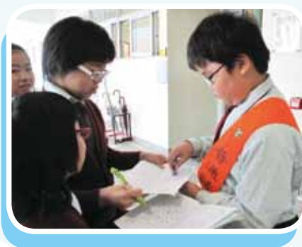
同學們都踴躍參與普通話積分簿