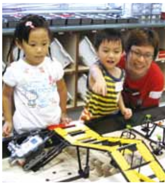
親子共同操作電腦機械人。

為了讓本區幼稚園高班學生及家長及早體驗小學生活，以便升讀小一時能盡快適應小學課程，先後舉辦「小學生活新體驗」、「科藝創意親子體驗日」活動。內容包括電腦機械人製作、親子視藝創作及親子英語唱遊。來自本區不同幼稚園的學生，經本校老師引導下，均能充分發展其語文及科藝創意潛能；同時，亦讓家長初步認識本校的課程特色。