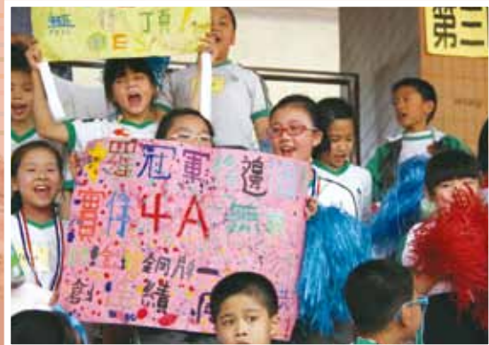
啦啦隊熱烈為同學打氣