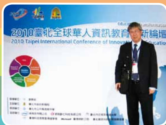
校長於12月8日至10日前往台灣參加「全球華人資訊教育論壇」，介紹本校推行資訊科技教育的策略。

事實上，「創意」是我們的主要校園文化之一，在「公開課」的多個課堂中，便可以看到老師如何積極鼓勵學生發表自己獨特意見的過程。我們相信，只有在一種支持、接納和鼓勵的氛圍下，學生的創意才可以充分的發展。